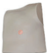
• Référence AV405 Peau pour buste