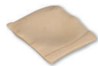
• Référence AV420 Module d'accès difficile port mouvant