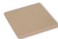
• Référence AV440 Module d'accès difficile port enfoncé