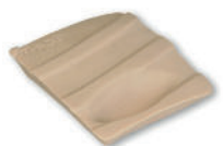
• Référence AV430 Module d'accès difficile port basculement