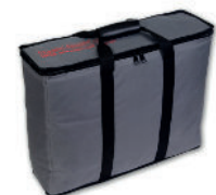
• Référence AV401 Sac de transport