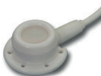
• Référence AV406 Chambre implantée