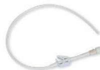
• Référence AV407 Catheter central veineux