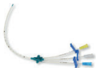
• Référence AV410 Catheter 3 voies