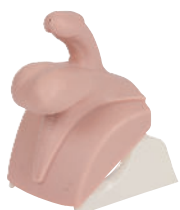
• Référence ALT60955 Module 4 : Epydideme