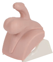
• Référence ALT60953 Module 2 : Varicocele