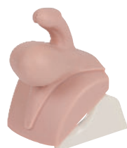
• Référence ALT60956 Module 5 : Hydrocelene