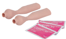
• Référence ALT60961 Peau décalottage