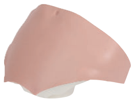
• Référence ALT60959 Insert abdominal