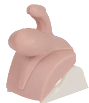
• Référence ALT60958 Module 7 : Hernie inguinale indirecte