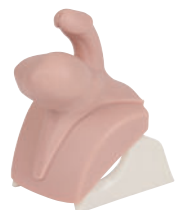
• Référence ALT60957 Module 6 : Orchiépididymite