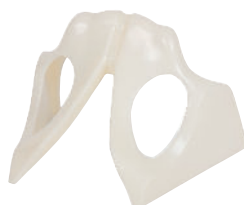
• Référence ALT60960 Os pubien