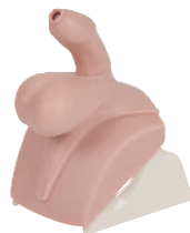
• Référence ALT60952 Module 1 : Normal de remplacement