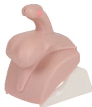
• Référence ALT60954 Module 3 : Tumeurs de remplacement